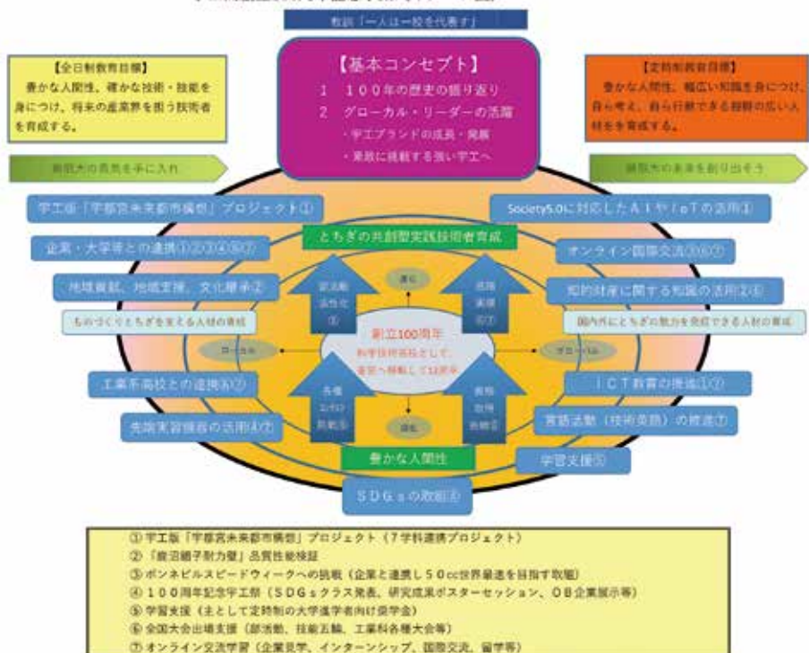
宇工高創立100周年記念事業(イメージ図)

ます。具体的には建築系では、未来都市構想の図面制作。環境系では、未来都市構想の模型製作及び交通網、施設配置の図面化。機械系では校内でのスマートモビリティ、自動運転自動車、みちびきなどのGPSを利用した有人ドローンの製作。電気系では、雀宮町などの観光案内アプリの開発(おすすすめスポット、歴史、食べ物などの情報提供)を行ってまいります。