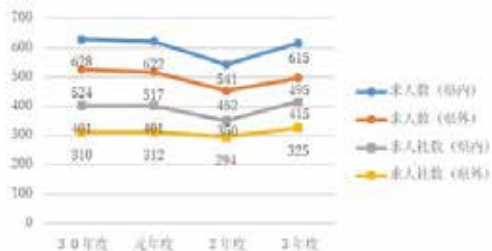
4年間の求人数・求人社数の推移

割合が高い傾向にありました。次年度も就職・進学ともにコロナ禍での活動になります。宇工生として誇りをもって乗り越えて活躍できる人材になって欲しいと思います